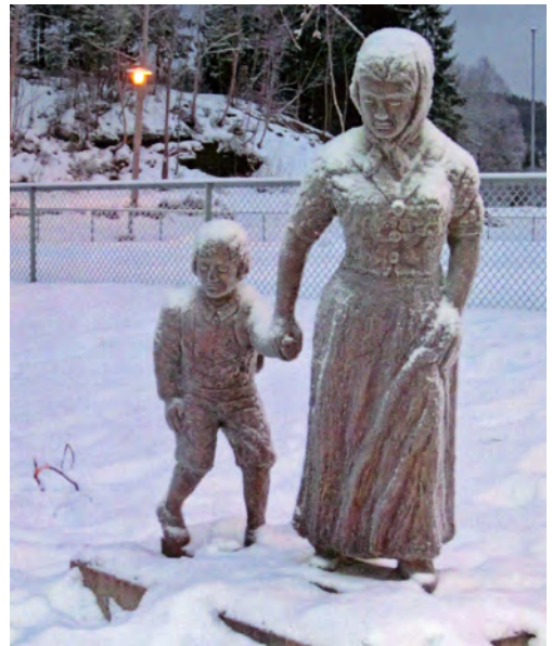
Forsidebilde på jubileumsboka 2016.