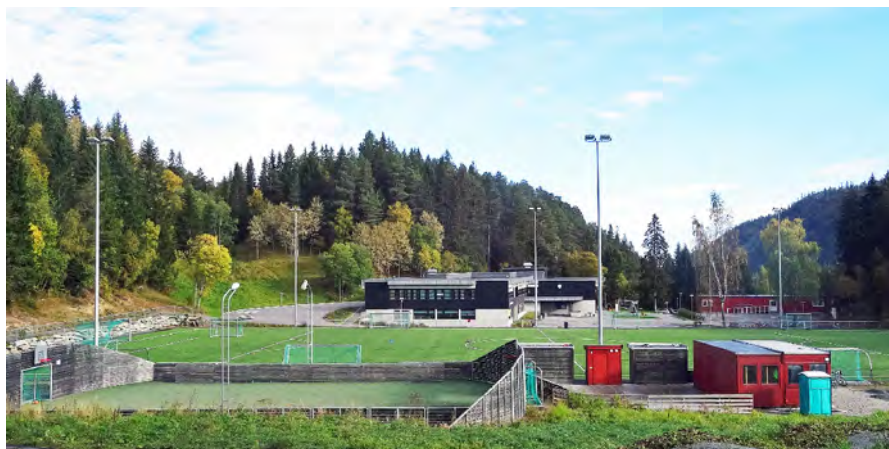
Solbakken idrettspark med kunstgressbane og ballbinge, begge med lysanlegg. Det er også en BMX-sykkelbane rundt hele anlegget.

Spesielt bra ble dette samarbeidet når idrettslaget investerte stort i idrettspark med kunstgressbane, BMX-sykkelbane og ballbinge. Idrettsparken ble åpnet i 2010 og er svært viktig for bygda.