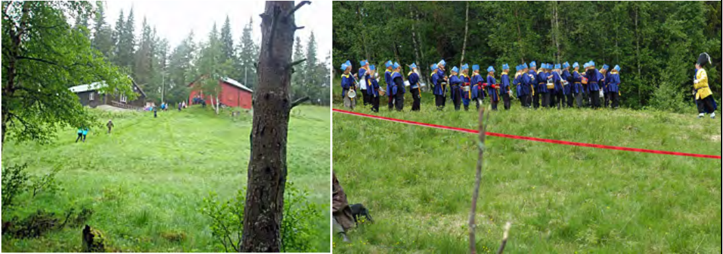
Til venstre: Schivevollen. Til høyre: Schivevollenspelet - Armfeldts soldater.

Schivevollen har også ved flere anledninger vært arena for kulturelle aktiviteter - som "Schivevollenspelet" i 2004. Spelet ble laget og framført av skolen - av elever, lærere og mange samarbeidspartnere.