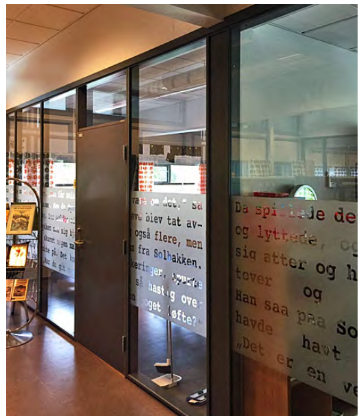
Skolen har glassvegger mot klasserommene med tekst fra Synnøve Solbakken av Bjørnstjerne Bjørnson.

Undervisningsarealene var ikke blitt større, men så å si alt var nytt innvendig. Skolen var endret fra å være en åpen skole med åpent læringsareal til en mer lukket skole med glassvegger mellom de ulike klassetrinn. Glassveggene gjør det lyst i arealet, samt at rommet føles åpent, og alle lett kan se hva som foregår av aktiviteter. Det var forskjellige forslag til utforming av glassveggene, men felles for alle forslagene var at det skulle være klart glass øverst. Det var forslag om ulike typer av råglass (glass som bare slipper gjennom lys, og som det er vanskelig å se igjennom), striper av ulik bredde i glasset samt at skolens skulptur skulle prege glassflatene. Valget falt imidlertid på tekst, Synnøve Solbakken av Bjørnstjerne Bjørnson. Navnet Solbakken gir assosiasjoner til