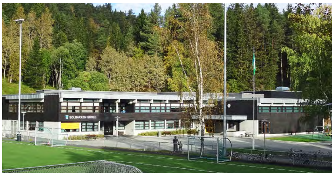
Skolen i dag - etter rehabiliteringen i 2013/14.

navnet på skolen, og fortellingen er i tillegg en viktig del av vår kulturarv. Ved å ha lesbar tekst på skilleveggene, vil elevene kunne se og lese denne, og bli interessert i hva den forteller. Tekst skaper nysgjerrighet. På glassveggene i læringsarealet kan elevene lese deler av kjærlighetshistorien. For å få vite hvordan det går, må elevene gå ned i første etasje og lese på glassveggene på arbeidsrommet til lærerne.