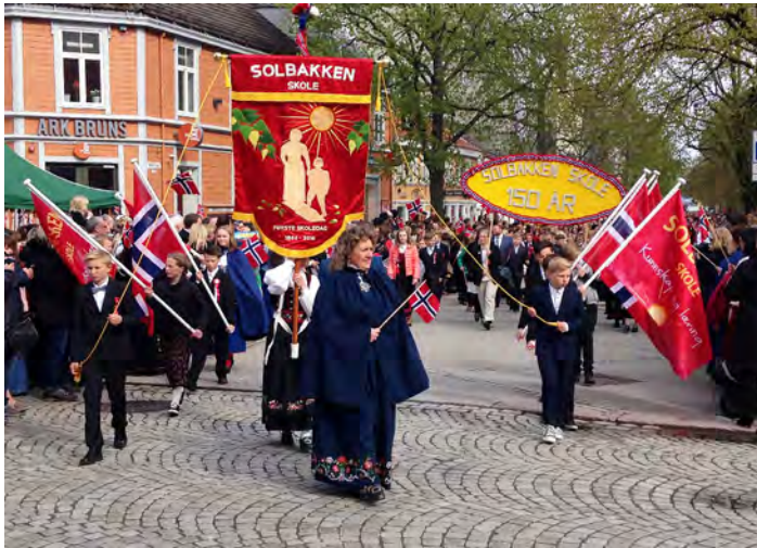
Først i 17. maitoget 1966 og 2016 - i år med den nye fanen.

drenes arbeidsutvalg), og skolen startet med å samle inn penger. Det var behov for mye penger! Tett opptil kr. 100 000. Sparebanken Midt-Norge bidro med hele beløpet, og ny fane kunne bli en realitet til 17. mai i jubileumsåret. Skolen - både ledelse, foreldre og elever, var ikke lite stolte da skolen gikk først i 17. maitoget i 2016 som i 1966.