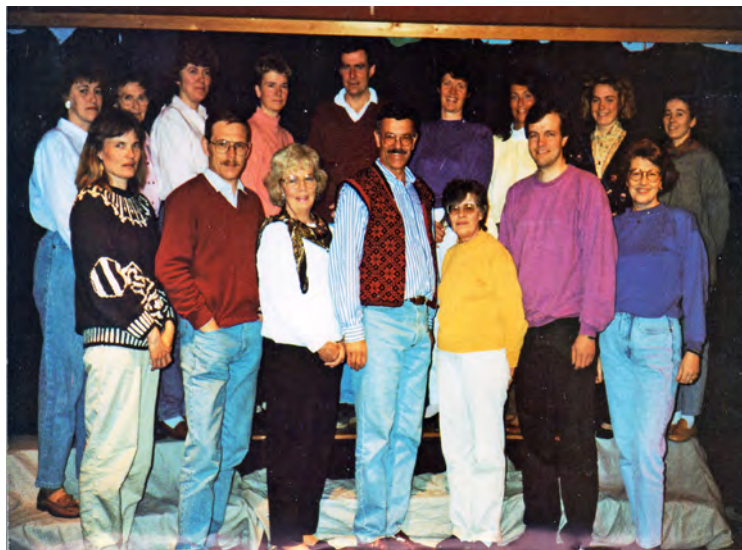
Ansatte i 1991: