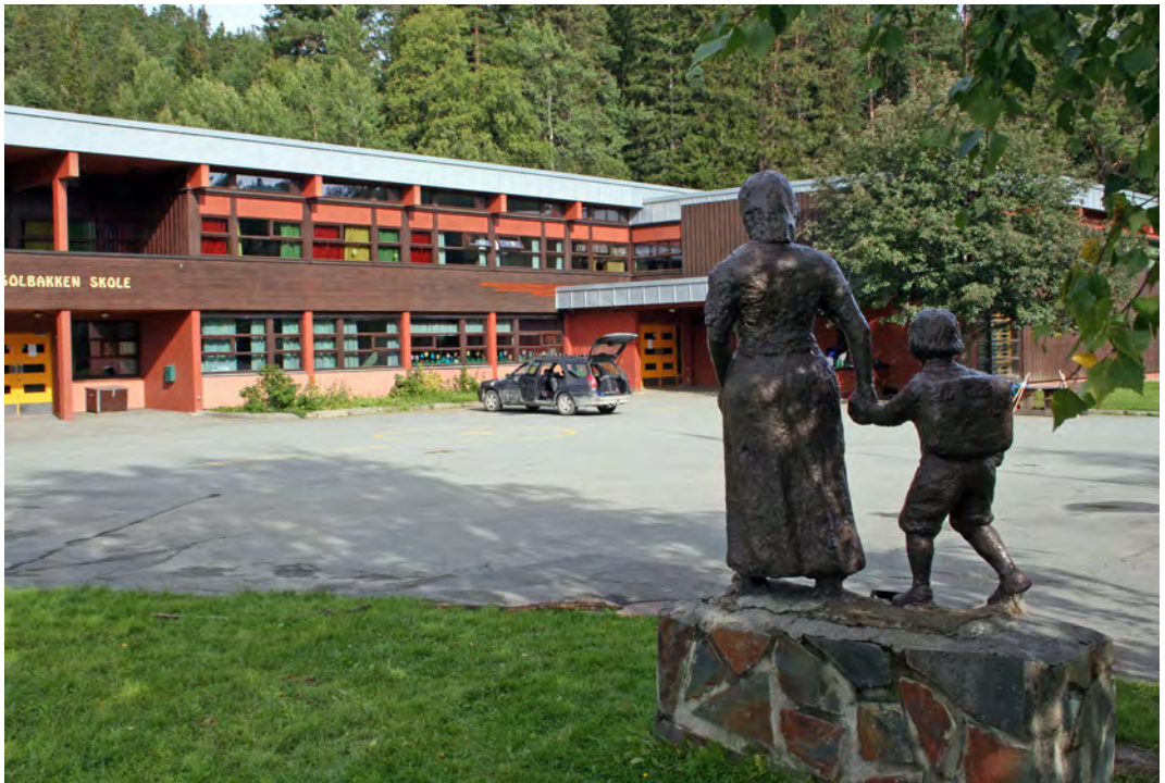
Solbakken skole 2007 - før rehabiliteringen, og med opprinnelig statue.