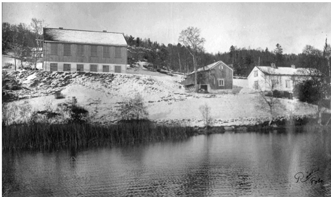
“Nyskolen” fra 1924, “gammelskolen”, og fjøset ca. 1930 - på en flaggdag. Den nye skolen hadde 2 klasserom i 1. etasje og sløyd- og håndarbeidsrom i kjelleren. I “gammelskolen” bodde fortsatt lærerfamilien.

Skolen fikk strøm i 1939, og vatnet ble innlagt samtidig som lærerboligen ble bygd i 1948. Inntil da ble vatnet hentet i bømte i en bekk like ved siden av skolen. Ei bømte til hvert klasserom. Do var fortsatt i fjøsbygningen fra gammelskolen.